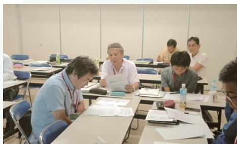
講義とワークショップの様子